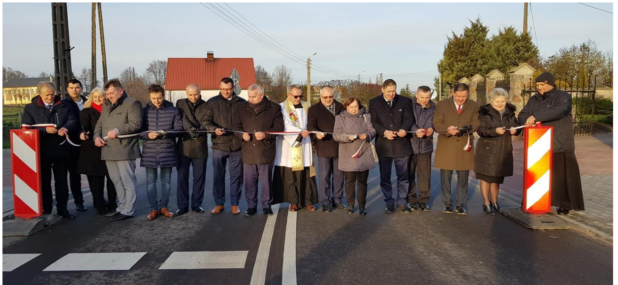
fot. 4. – Uroczysty odbiór drogi powiatowej w Ławsku