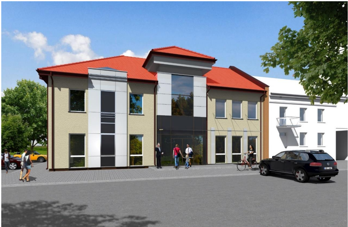
fot. 3 - Wizualizacja – projekt frontu budynku Urzędu Gminy Wąsosz