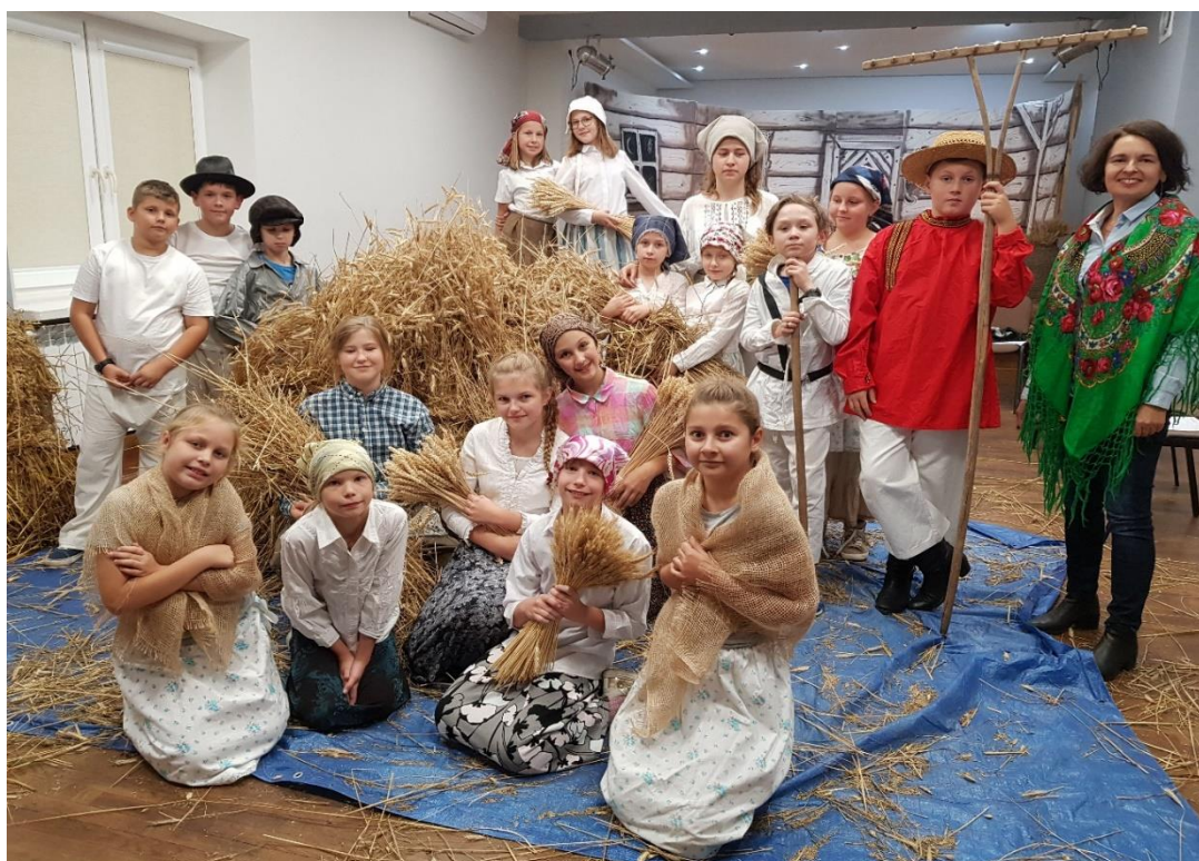
fol. 7 – Uczestnicy projektu „Tradycja dawniej i dziś...”

Dodatkowo GOKiS wspiera działania związane z funkcjonowaniem drużyny piłkarskiej juniorów „Czarni Wąsosz”, prowadzonej przez osoby spoza instytucji.