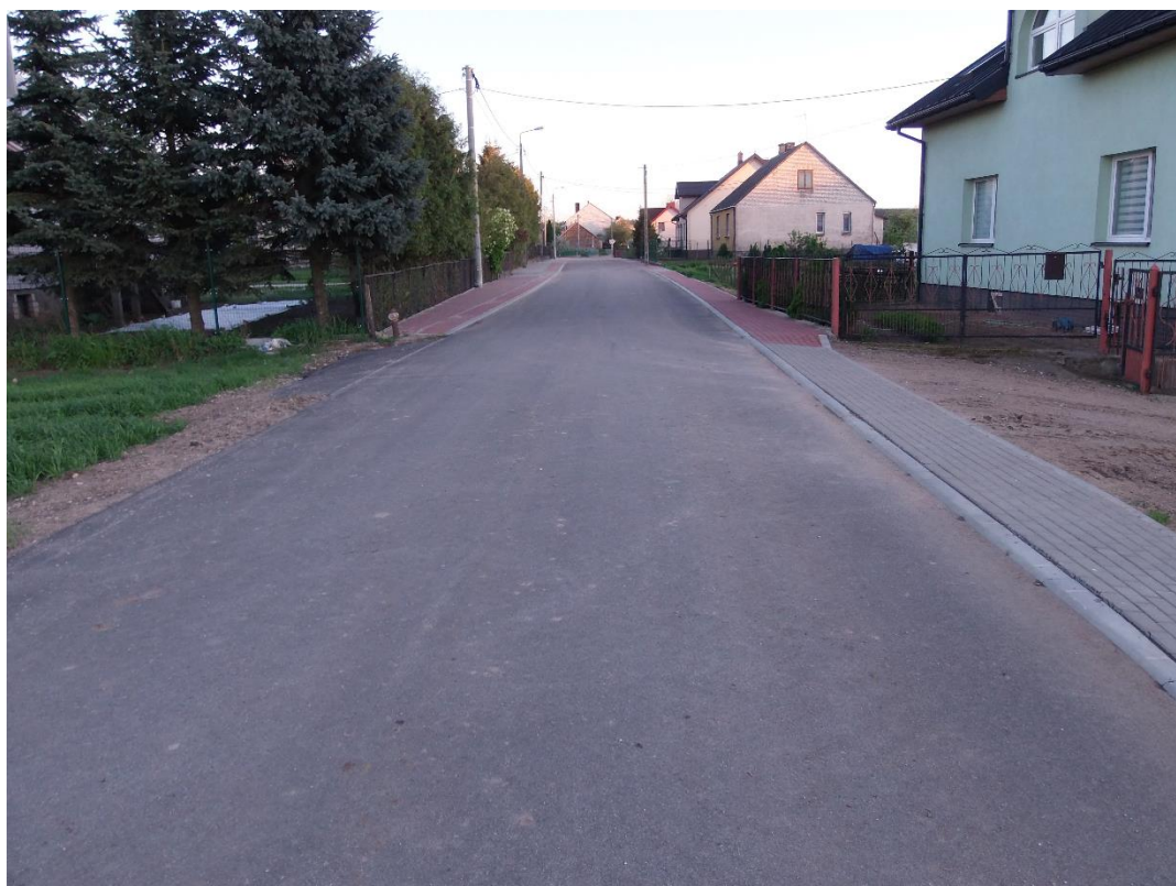
fot. 5 – Droga gminna w miejscowości Sulewo-Kownaty po przebudowie