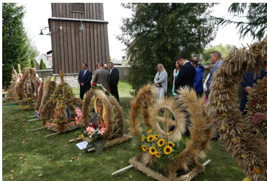
fot. 9 - Wystawa wieńców dożynkowych