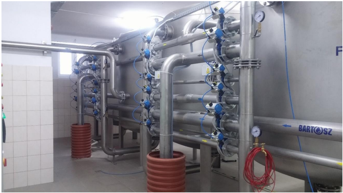
fot. 1. Wnętrze stacji uzdatniania wody w Ławsku po przebudowie