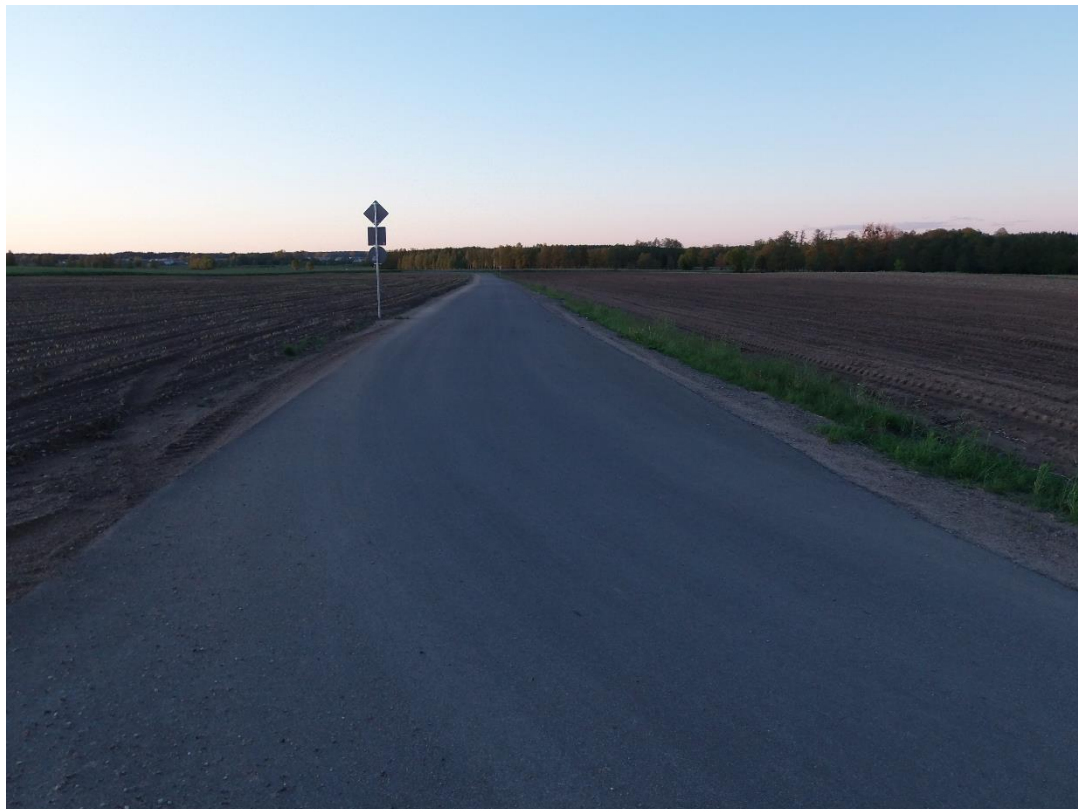
fot. 6 - Droga gminna Zalesie – Sulewo-Kownaty po przebudowie