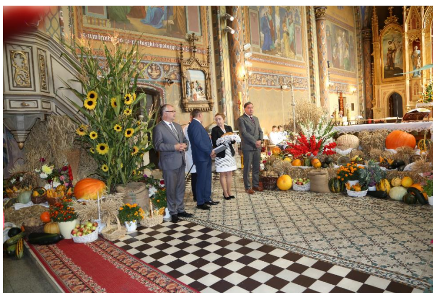
fot. 8 - Uroczysta msza Święta w Kościele pw. Przemienienia Pańskiego w Wąsoszu

W trakcie uroczystości nagrodzono autorów pięknie wykonanych wieńców dożynkowych.