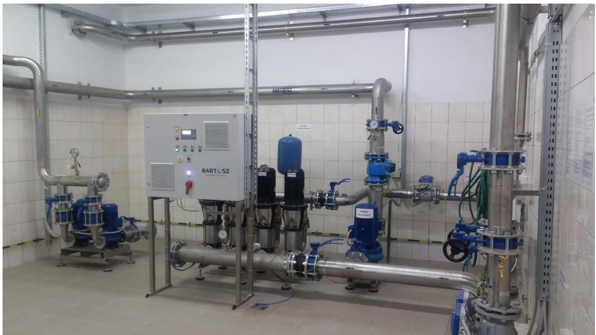
fot. 2. Wnętrze stacji uzdatniania wody w Ławsku po przebudowie