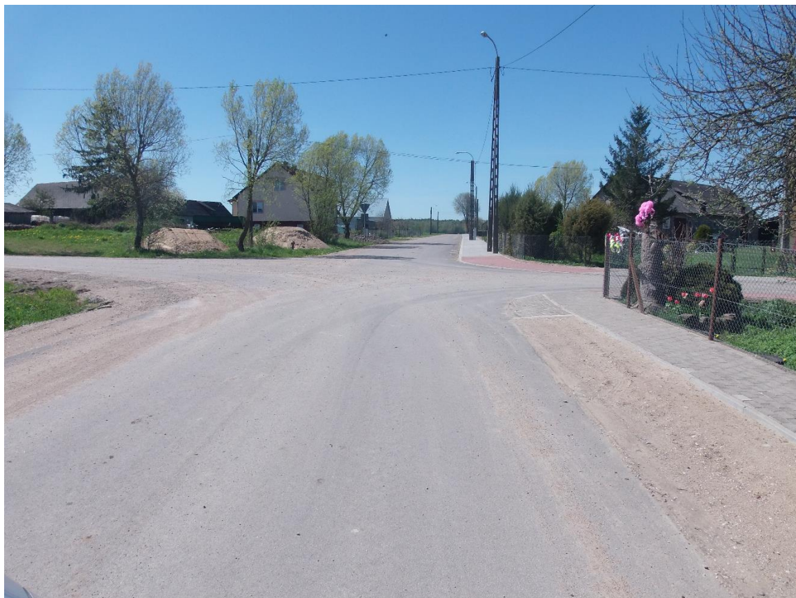
fot. 6 - Drogi gminne we wsi Modzele (po przebudowie).