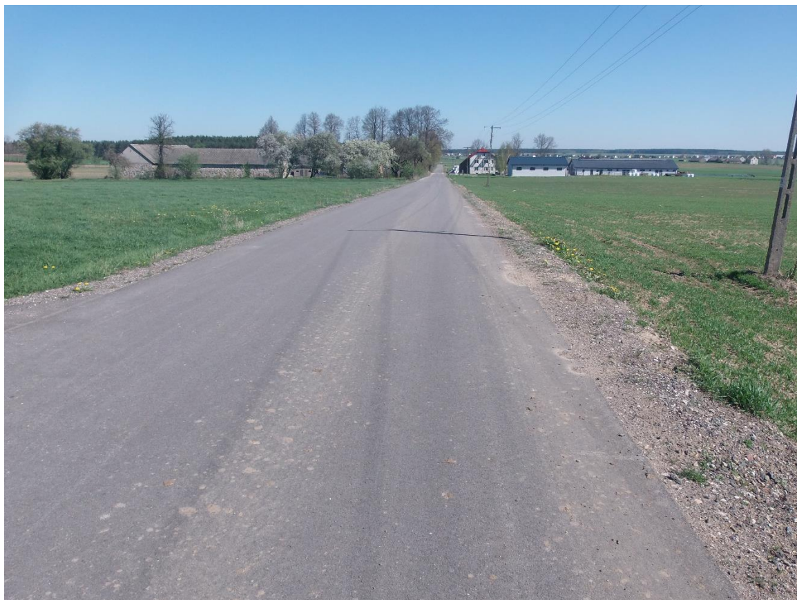
fot. – Drogi gminne w miejscowości Komosewo (po przebudowie).