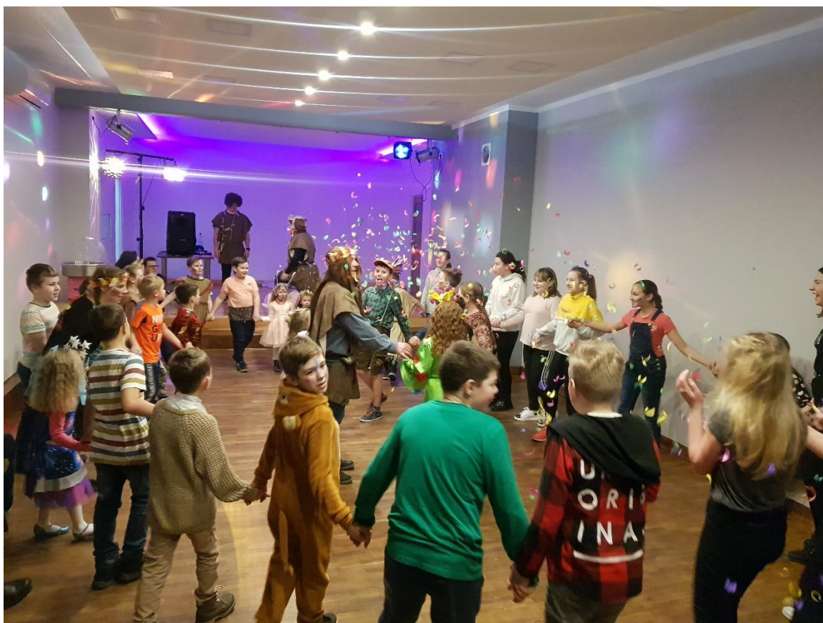
fot. Uczestnicy zajęć organizowanych w GOKiS.