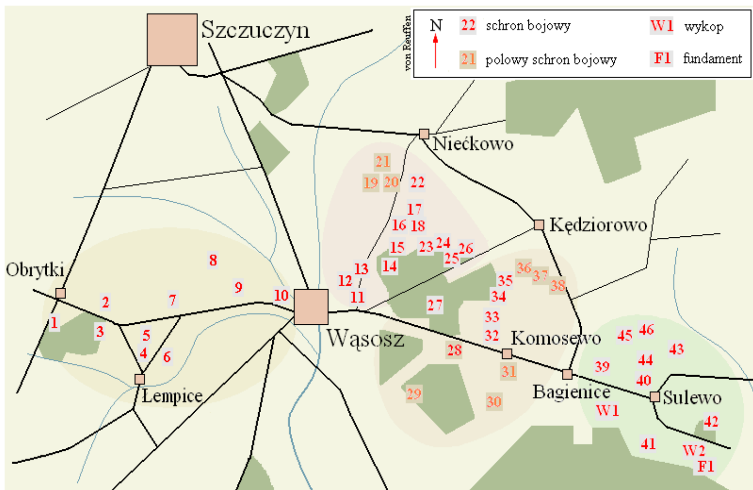
Obrytki, Wąsosz, Komosewo, Sulewo. Rozmieszczenie schronów